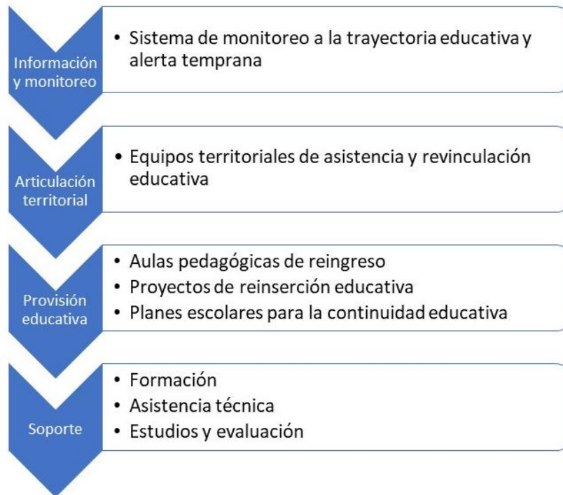
Figura 4. Sistema de garantía de trayectorias educativas.

Este sistema de garantías cuenta con un mecanismo de evaluación que se está desarrollando con SUMMA, el Laboratorio de Investigación e Innovación en Educación para América Latina y el Caribe, en alianza con el Fondo Impacto Education Endowment Foundation, el cual tiene como propósito el seguimiento y evaluación de las políticas para el resguardo del derecho educativo promoviendo calidad, equidad e inclusión en el sistema educativo.