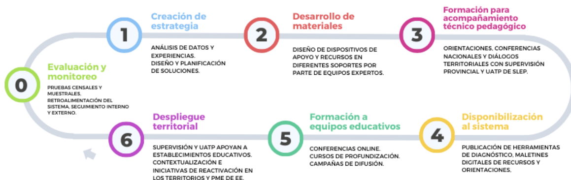
Figura 2. Modelo de desarrollo de estrategias para el fortalecimiento de aprendizajes.

El diseño e implementación de cada una de las estrategias para la reactivación de aprendizajes se considera como fundamental la participación de las diversas actorías del sistema educativo. Para potenciar la apropiación de las estrategias , como Ministerio de Educación nos aseguramos de que los equipos ministeriales de todo el país conocen en profundidad las acciones y sus recursos, y están en condiciones de promover y asesorar su uso en los establecimientos educacionales, proporcionándoles la formación e información necesaria.