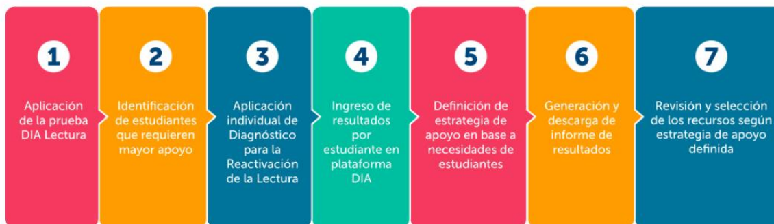
Figura 3. Ruta de aplicación del Diagnóstico para la Reactivación de la Lectura