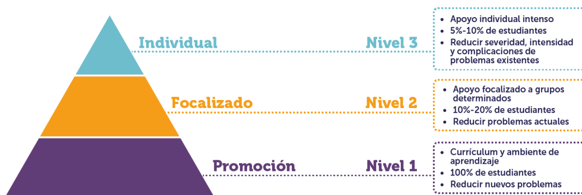
Figura 1: Estrategia de apoyo al bienestar socioemocional de las comunidades escolares en contexto COVID-19 2 .

Las acciones de este eje buscan abordar desde el modelo de Escuela Total, y orientados por las propuestas para educación de la Mesa Social COVID-19, los problemas vinculados a la convivencia y la salud mental de quienes son parte de las comunidades educativas del país, reconociendo que estos ámbitos son parte relevante del proceso de aprendizaje y, a la vez, condición para el logro de otros aprendizajes. Se trabaja en torno a 3 niveles de intervención: desde la promoción de la convivencia y la salud mental como base para ir focalizando recursos y atenciones, hasta situaciones críticas y específicas que requieren una atención de mayor especialización.